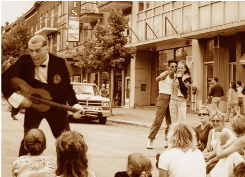
Shawinigan, Québec 2001

SPECTRALEX - Le Muscle Contact : Pascal ROBERT 38, rue Jolivet - 37000 Tours tél : 06 99 51 79 49 Mail : spectralex1@gmail.com